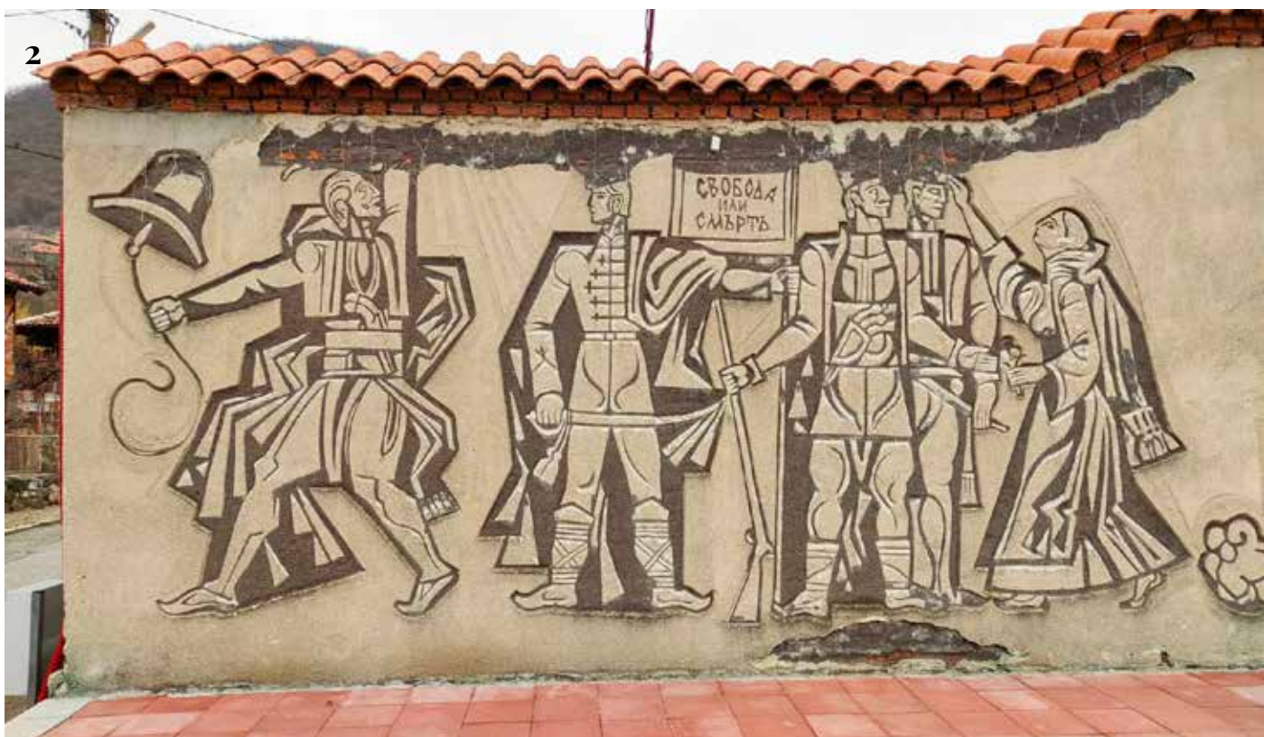
1. Общ изглед на сграфитото преди намесите от 2025 г.