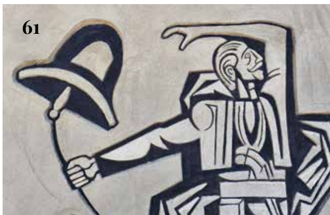
57-62. Детайли от сграфитото след намесите от 2025 г.