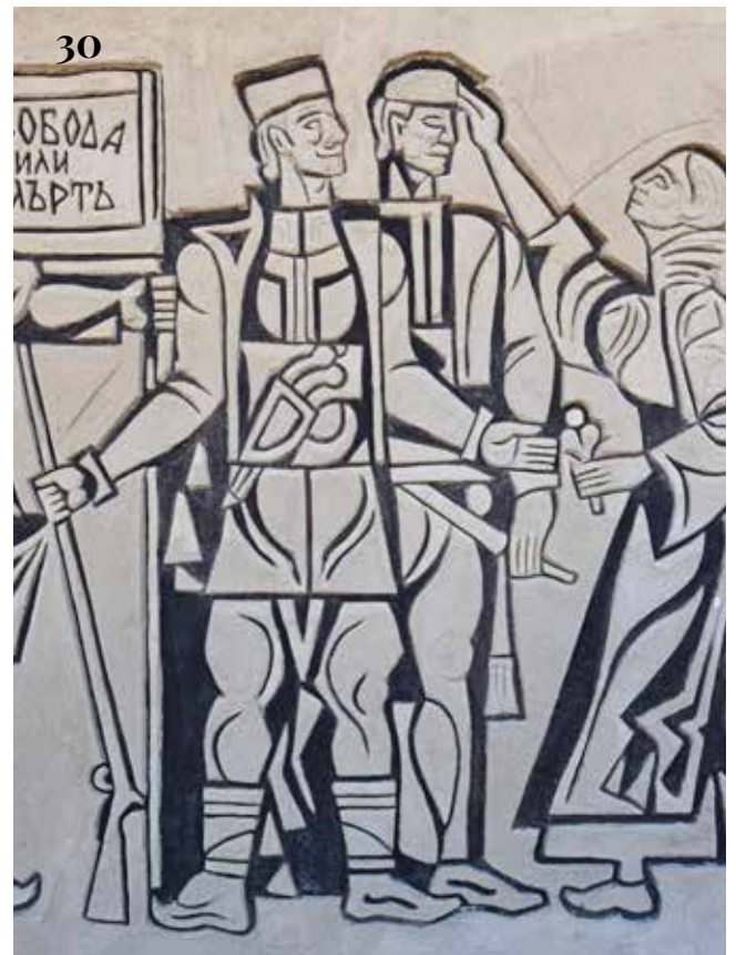
27, 29. Детайл от източната фигурална композиция преди намесите от 2025 г.