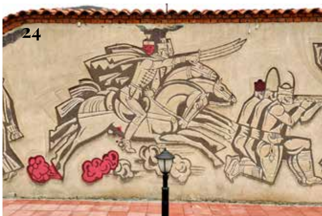
22-24. Схема на значително променените участъци след намесите през 2025 г.