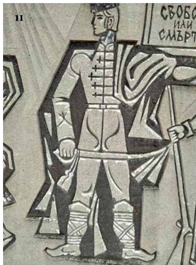
8-11. Детайли от сграфитото преди намесите от 2025 г.