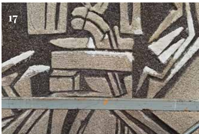
14. Общ изглед на източната фигурална композиция по време на намесите от 2025 г. 15-17. Детайли на направените китове и възстановки на източната фигурална композиция по време на намесите от 2025 г.