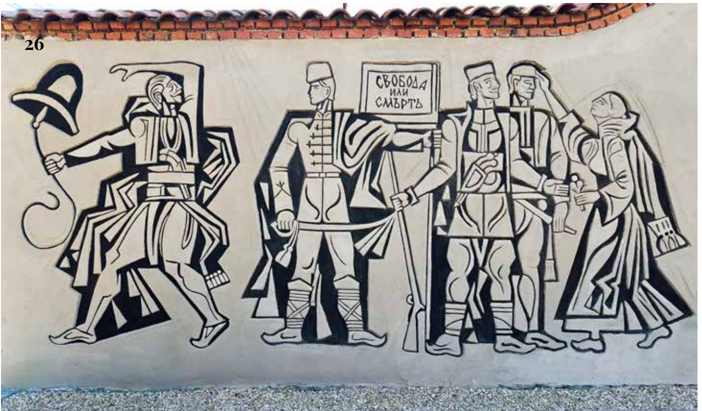
25. Общ изглед на източната фигурална композиция преди намесите от 2025 г.