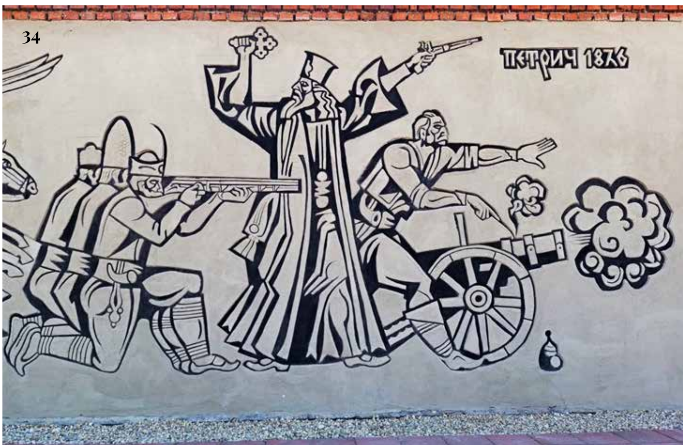
33. Част от централната фигурална композиция преди намесите от 2025 г.