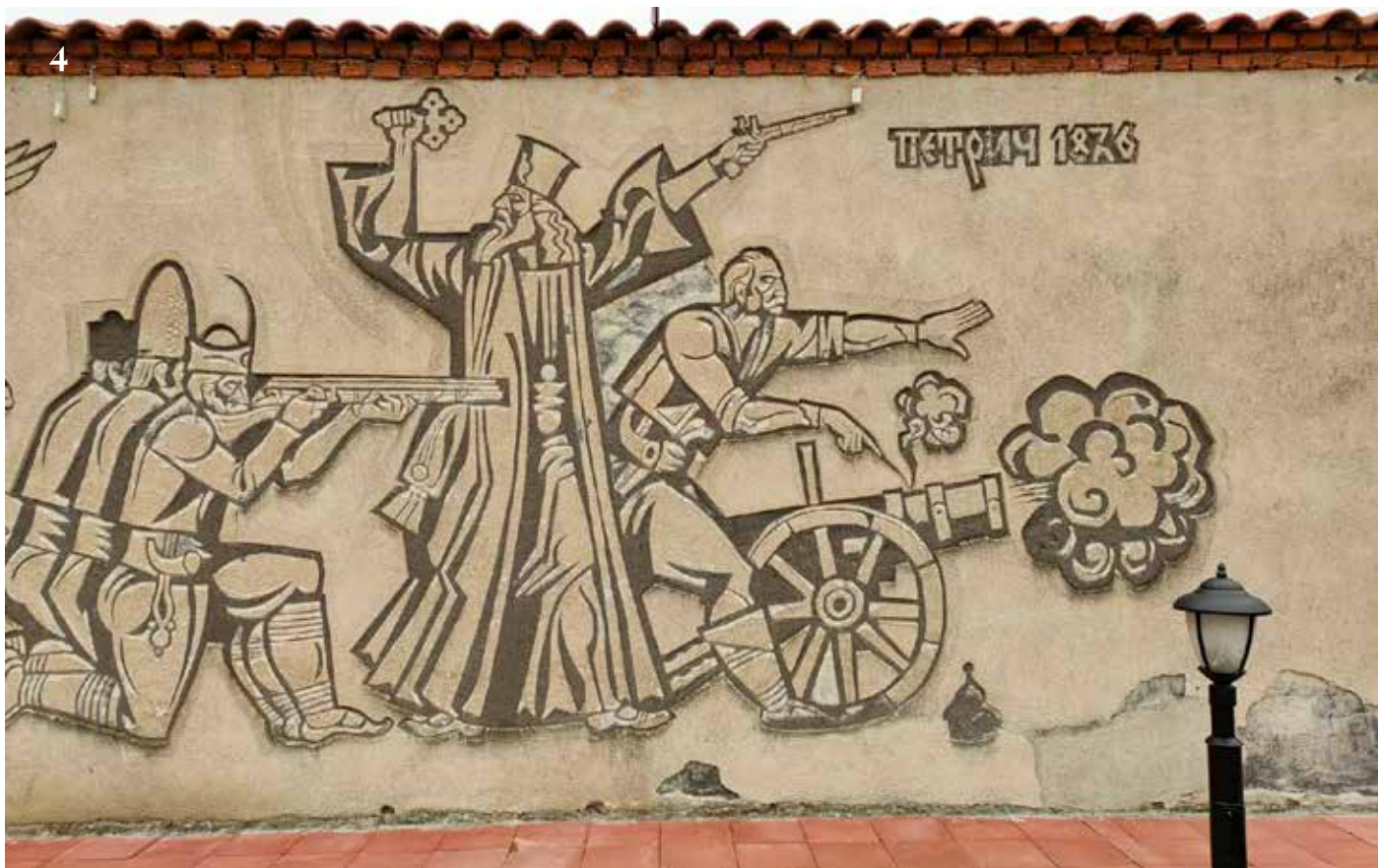
3-4. Централната и западната, фигурални композиции на произведението преди намесите от 2025 г.