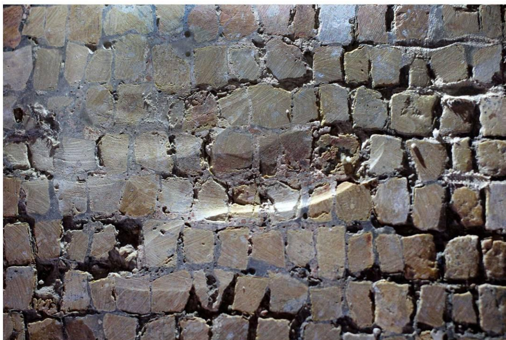
Следи от машинно шлайфване по повърхността на фрагментите.